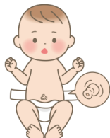
でべそ(臍ヘルニア)

脳、心臓、骨はそれぞれの専門診療科がありますので、それら以外の体の部位で手術が必要なとき、小児外科医の出番です。例えばもうちょう(虫垂炎)や、でべそ(臍ヘルニア)、陰茎や精巣の疾患(包茎・停留精巣)などを扱います。見た目の問題から内臓の異常まで、小児外科では手術をして治療します。